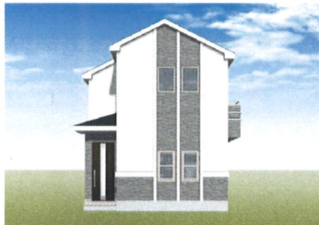
こちらのイメージは図面を基に描き起こされており、実際とは多少異なる場合がございます。