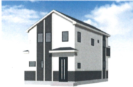
このパースは図面を基に書きおこされており、実際とは多少異なる場合がございます。